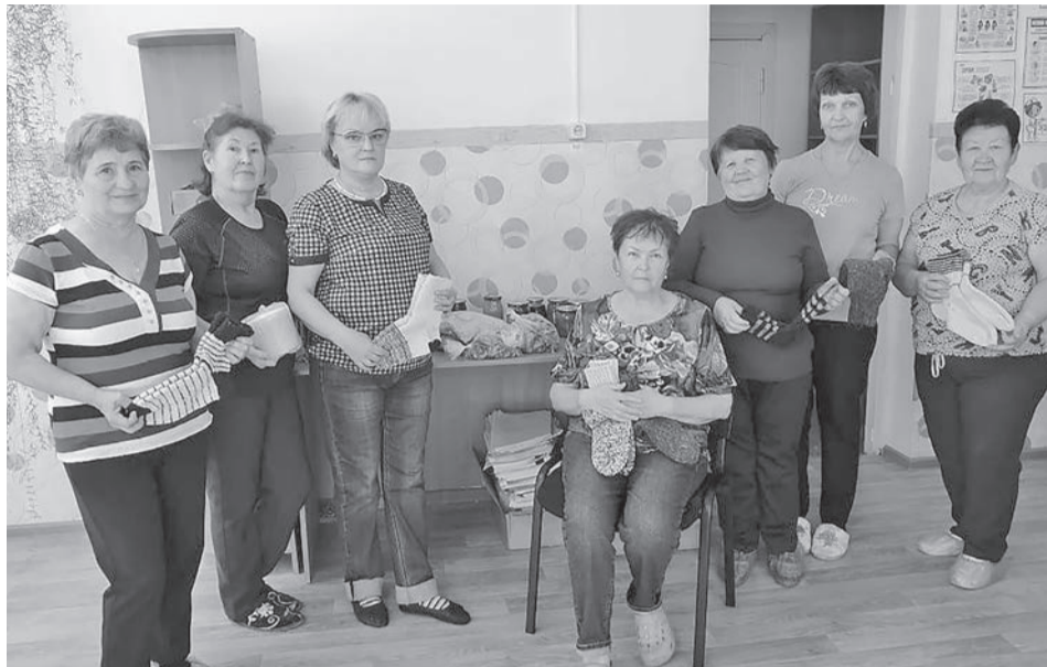
Тёплые вязаные носки для солдат – от активисток КЦСОН.