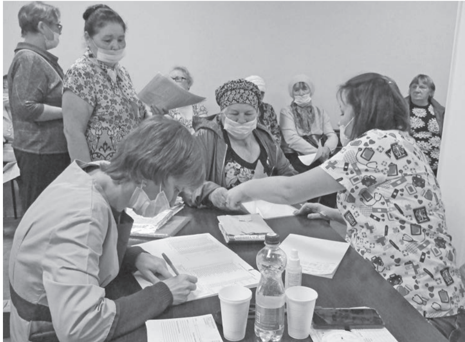
В течение дня диспансеризацию прошли более ста человек.

Не остались без внимания маломобильные пациенты. Медики и волонтеры в рамках Школы