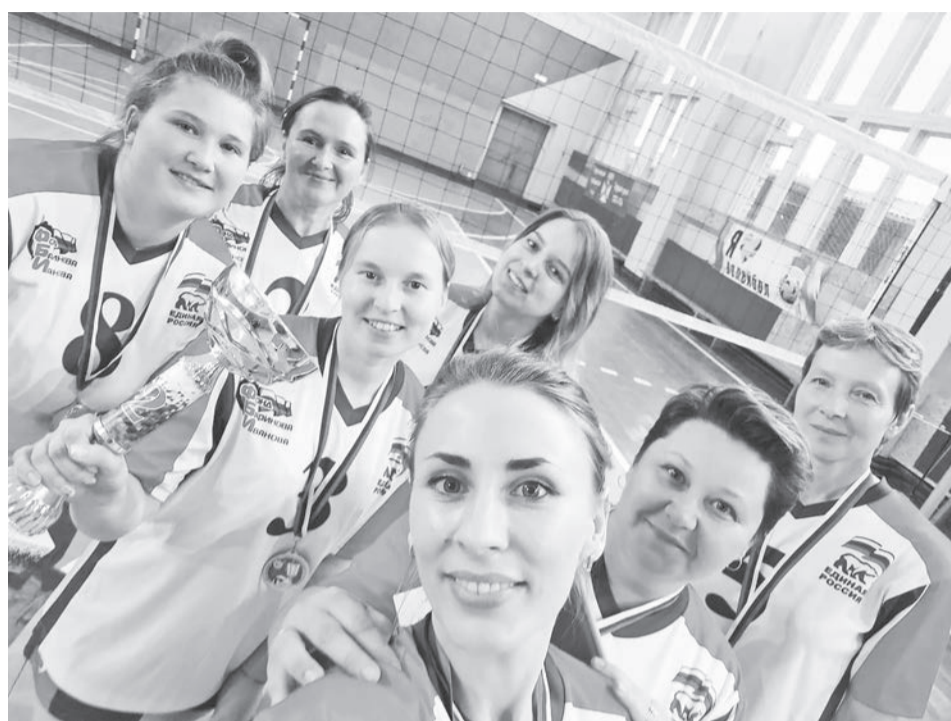
Женская сборная району по волейболу.