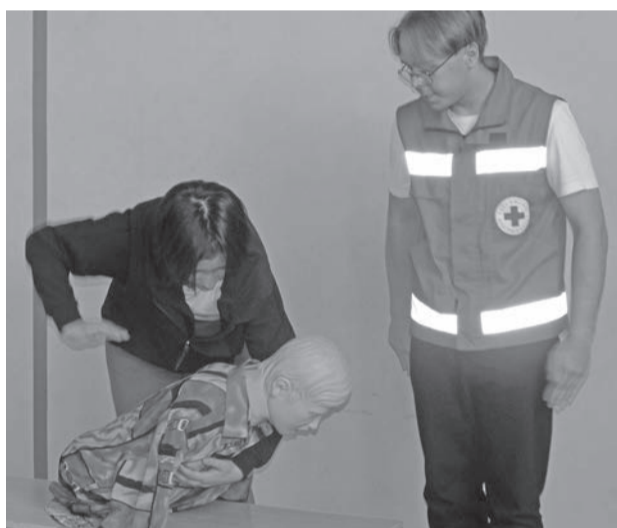
Мастер-класс по оказанию первой помощи.

Для учащихся среднего звена были подготовлены мастер-классы