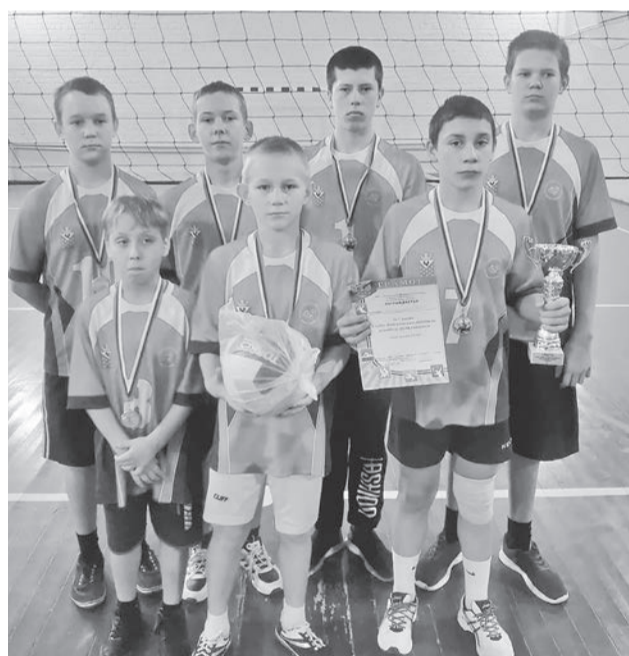
В группе 5-9 классов среди юношей лучшими были шадринцы, а у девушек – ляпуновские ученицы.

В младшей группе турнир оказался не самым представительным. У юношей было всего три команды. Уверенную победу одержали волейболисты Шадринской средней школы, переиграв в двух партиях сверстников из Вязовки и подросткового клуба «Липовка». Вязовская команда стала второй, липовцы – третьими. У девушек за победу боролись четыре коллектива. Здесь наиболее цельную и поставленную игру показала команда ляпуновской школы,