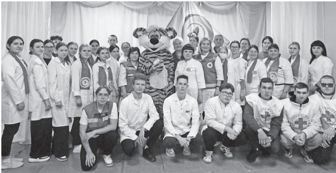
В Шадринке побывал медицинский десант.

В течение дня диспансеризацию прошли более ста человек. Для них действовали офтальмологический комплекс областного медколледжа, флюорограф областного центра фтизиопульмо-